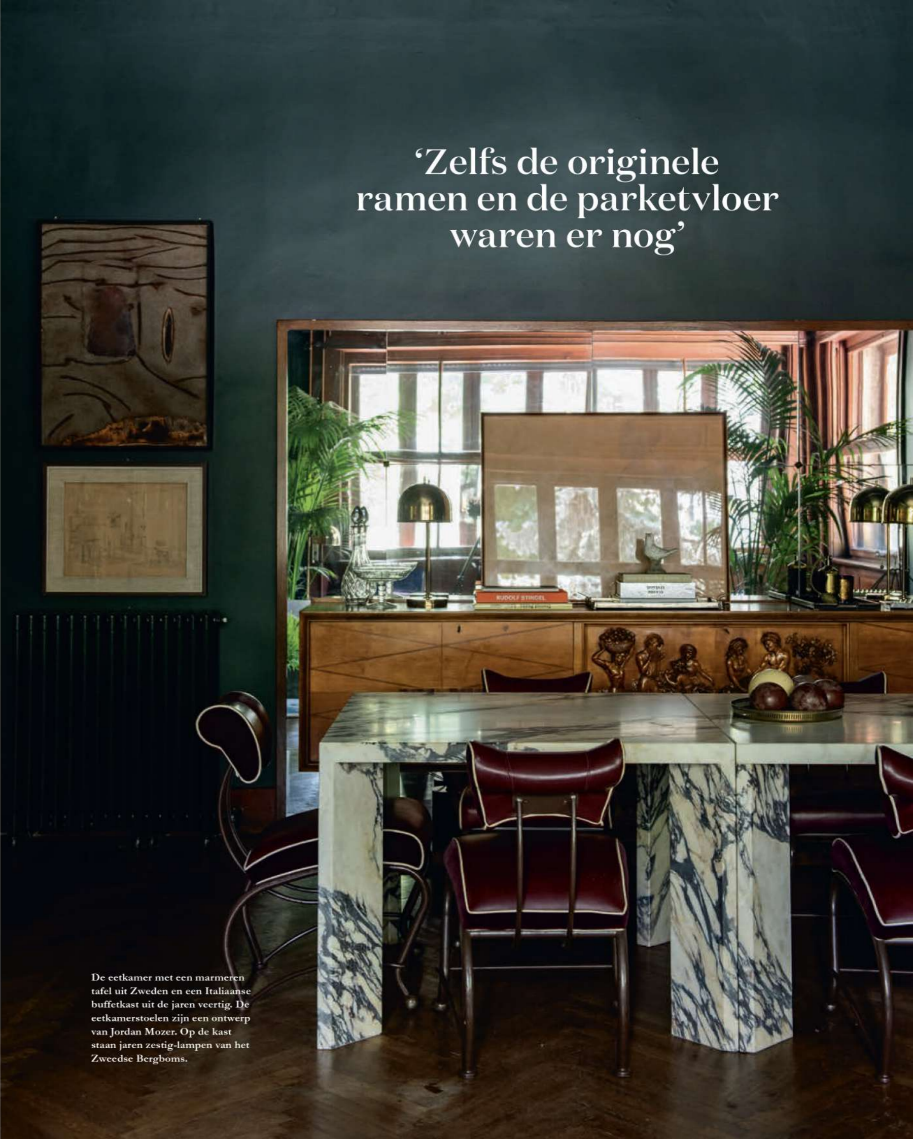
De eetkamer met een marmeren tafel uit Zweden en een Italiaanse buffetkast uit de jaren veertig. De eetkamerstoelen zijn een ontwerp van Jordan Mozer. Op de kast staan jaren zestig-lampen van het Zweedse Bergboms.

'Zelfs de originele ramen en de parketvloer waren er nog'