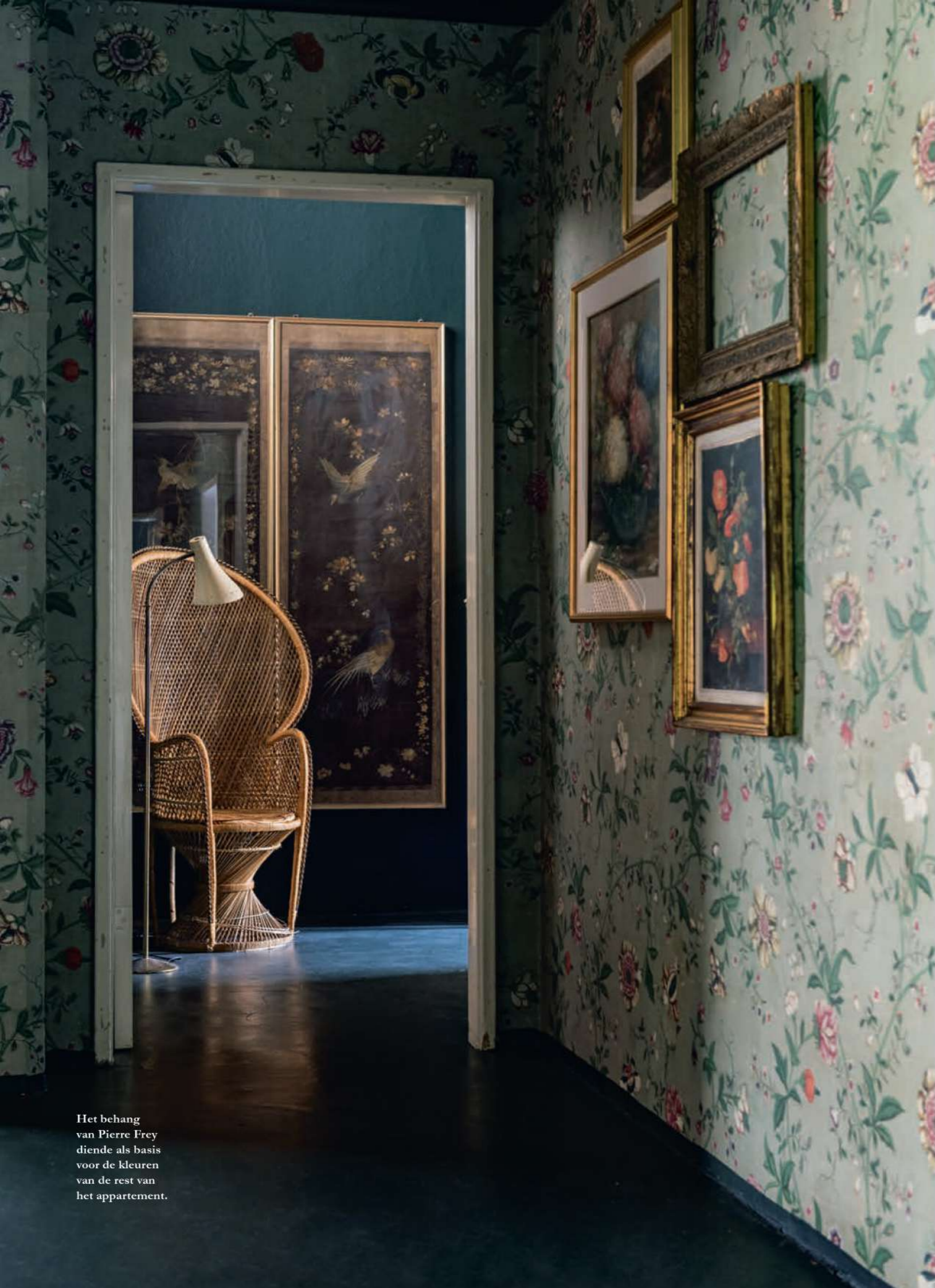
Het behang van Pierre Frey diende als basis voor de kleuren van de rest van het appartement.